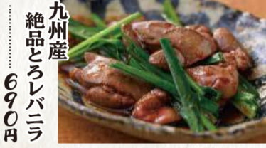
九州産 絶品とろレバーニラ 690円