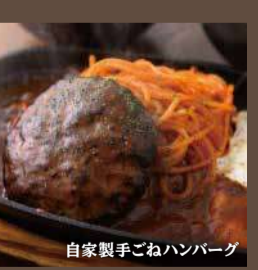
自家製手ごねハンバーグ定食 990円