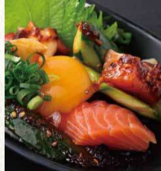
国産サーモンユッケ 790円