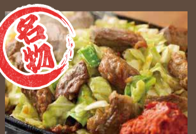
びっくり辛味噌焼肉鉄板定食 1,100円 びっくり辛味噌焼肉鉄板定食 <1.5倍> 1,450円