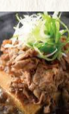
牛すじ肉じゃが 赤ワイン煮込み、パケット添え 750円