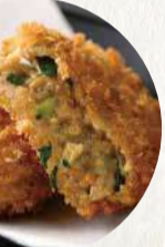
博多明太もつ鍋カツ 290円