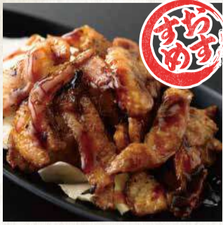
パリパリ鶏皮焼~今治風~ 390円