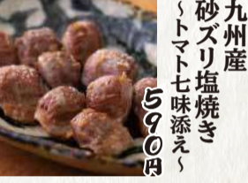
九州産 砂スリ塩焼き トマト七味添え 590円