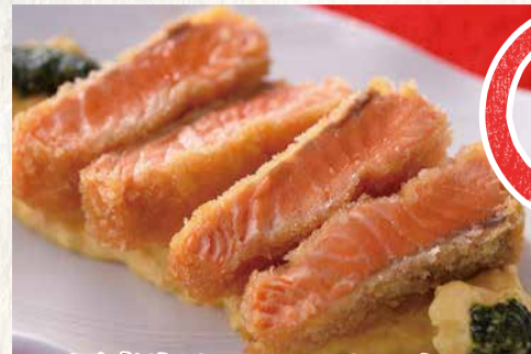
国産生サーモンのレアカツ 1,200円