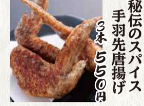
秘伝のスパイス 手羽先唐揚げ 3本 550円