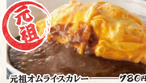
元祖オムライスカレー 780円 オムチーズカレー 880円 唐揚げ オムライスカレー 960円 チキン南蛮 オムライスカレー 990円 チキンカツカレー 940円 カレー大盛り プラス200円