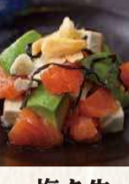
生サーモンとアボカド クリームチーズの塩昆布和え 690円