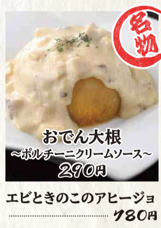
おでん大根 ~ポルチーニクリームソース~ 290円 エビときのこのアヒージョ 780円