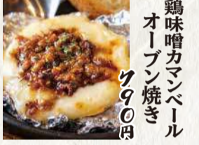
鶏味噌カマンベール オープン焼き 790円