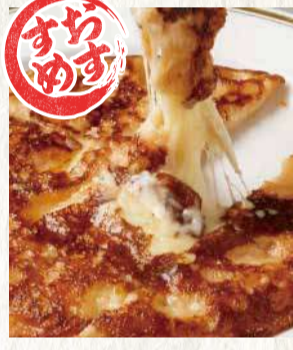
絶品たっぷり チーズチヂミ 690円

たっぷりニラチヂミ 690円 四川風麻婆豆腐 780円 雲仙高原ハムエッグ 450円