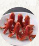
うちの創作ポテトサラダ 490円