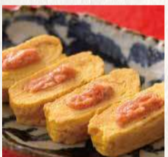
博多鮭明太だし巻き玉子 590円

たっぷりニラチヂミ 690円 四川風麻婆豆腐 780円 雲仙高原ハムエッグ 450円