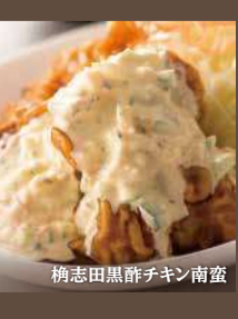
梅志田黒酢チキン南蛮 990円