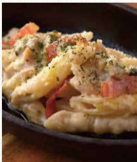
大人の鉄板焼き ナポリタン 880円

ポルチーニクリームソースペンネ 790円 フレッシュ大葉とバジルのジエノベーゼペンネ 980円 カリカリベーコンアラビアータペンネ 990円