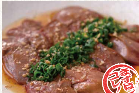
九州産 新鮮とろレバー炙り ~ゴマ油と塩で~ 590円