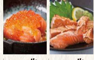
生サーモン 炙り刺 890円