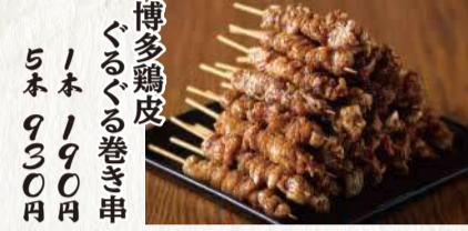
博多鶏皮 ぐるぐる巻き串 1本 190円 5本 930円