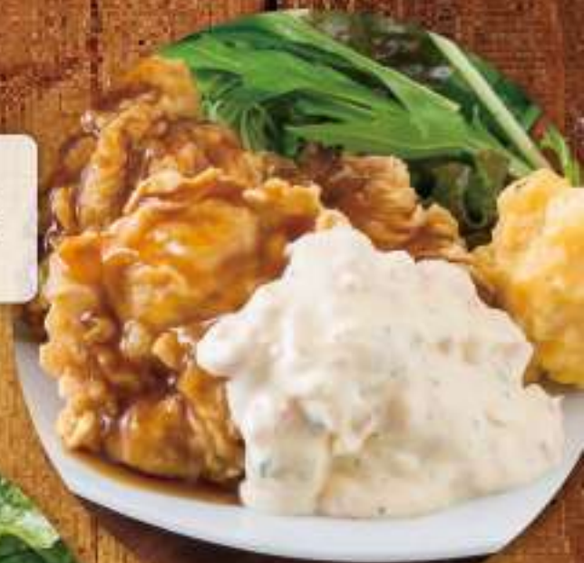
栴志田の 黒酢チキン南蛮定食 ¥1,000 (税込 ¥1,100)