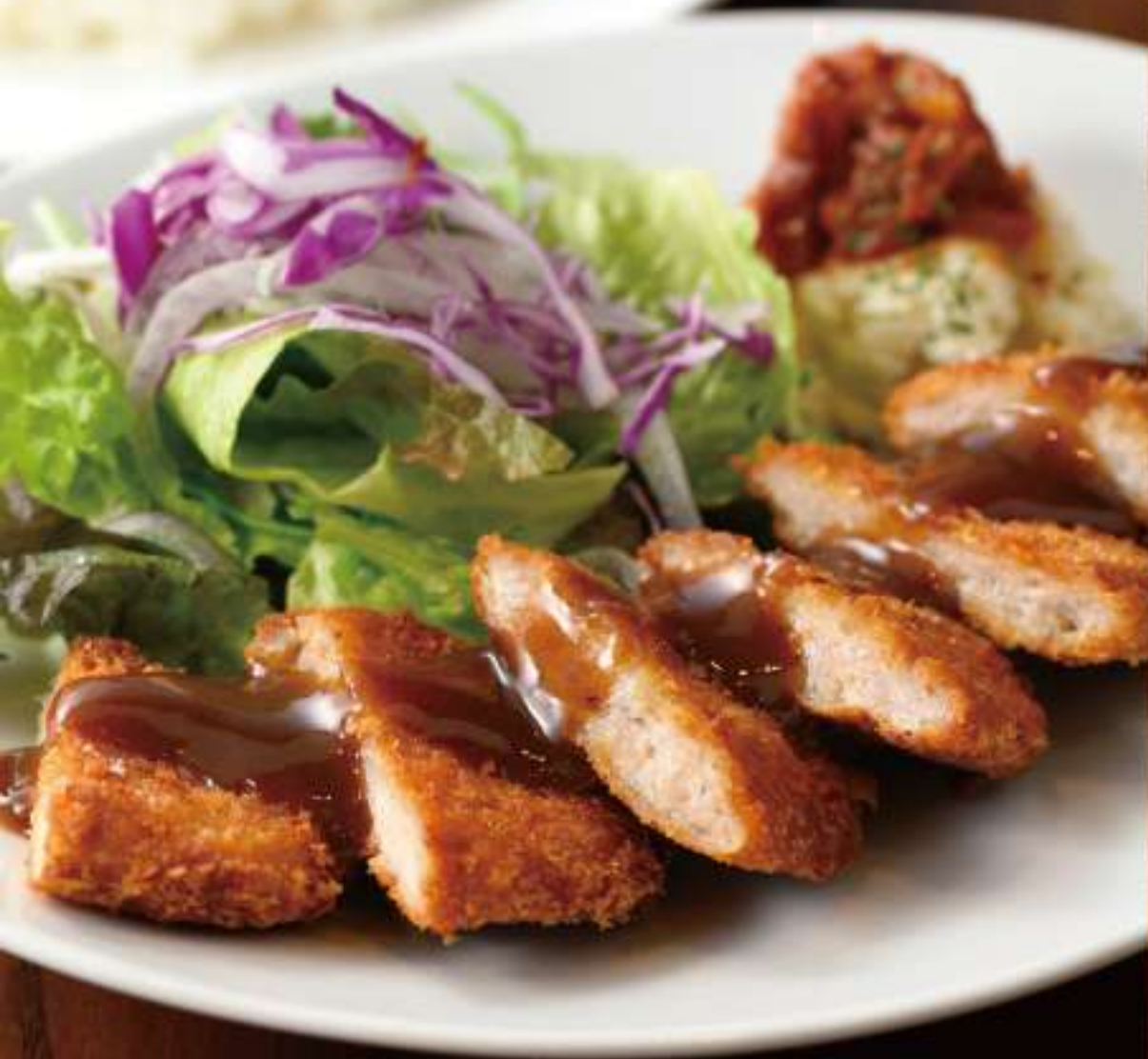
ヒレカツ定食 ¥1,164 (税込 ¥1,280)