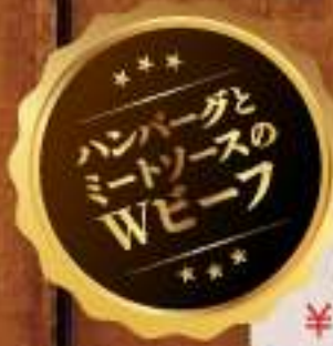
ボロネーゼ ハンバーグ定食 ¥1,073 (税込 ¥1,180)