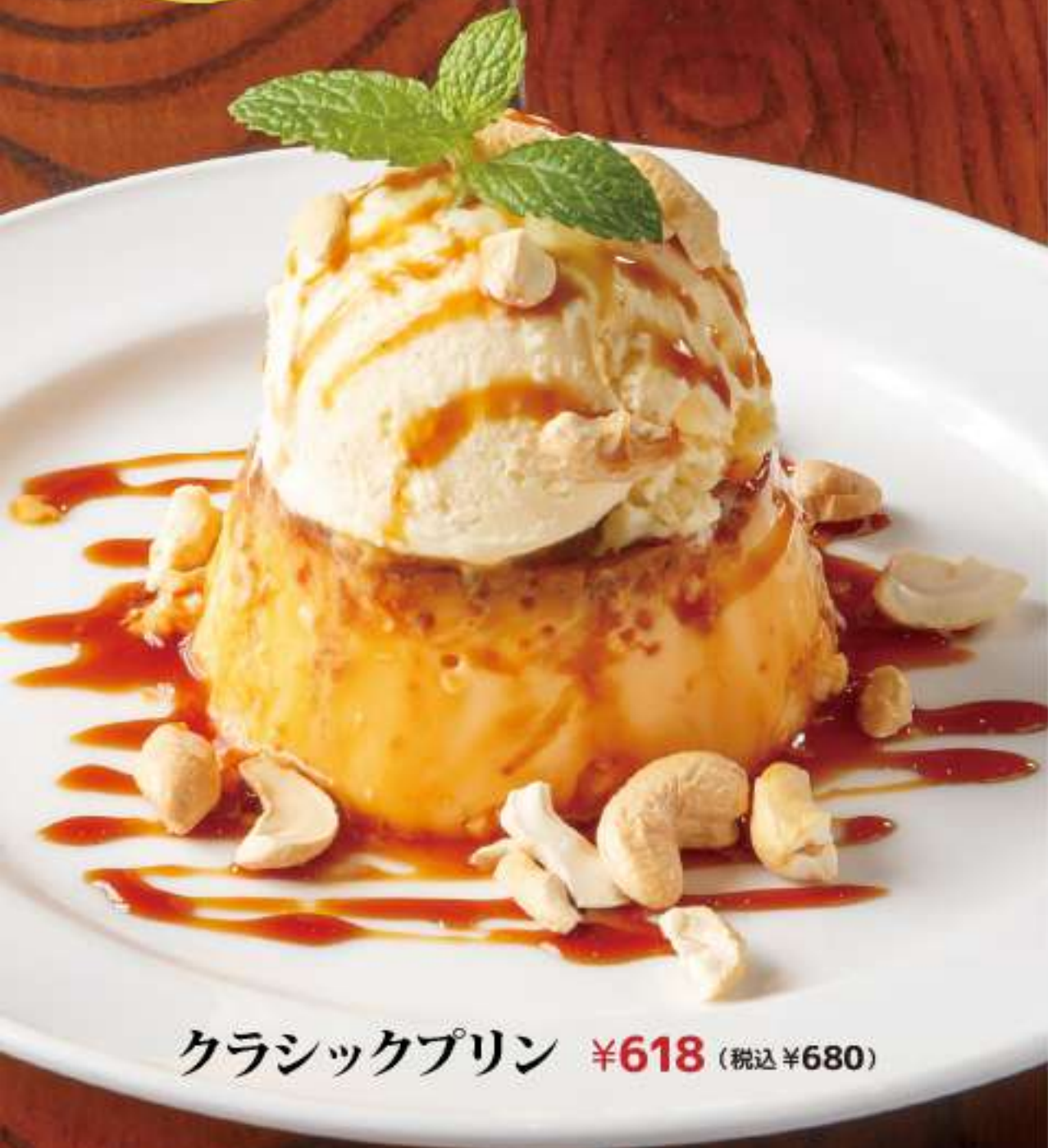
クラシックプリン ¥618 (税込 ¥680)

佐賀鹿島『うみやまここ』を 使用した昔ながらの固めのプリン。 バニラアイスと一緒にどうぞ。