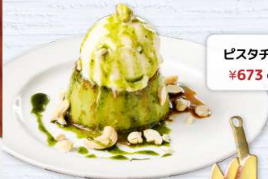
ピスタチオプリン ¥673 (税込 ¥740)