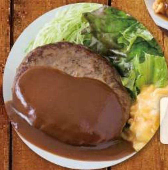
ビーフデミグラス ハンバーグ定食 ¥1,073 (税込 ¥1,180)