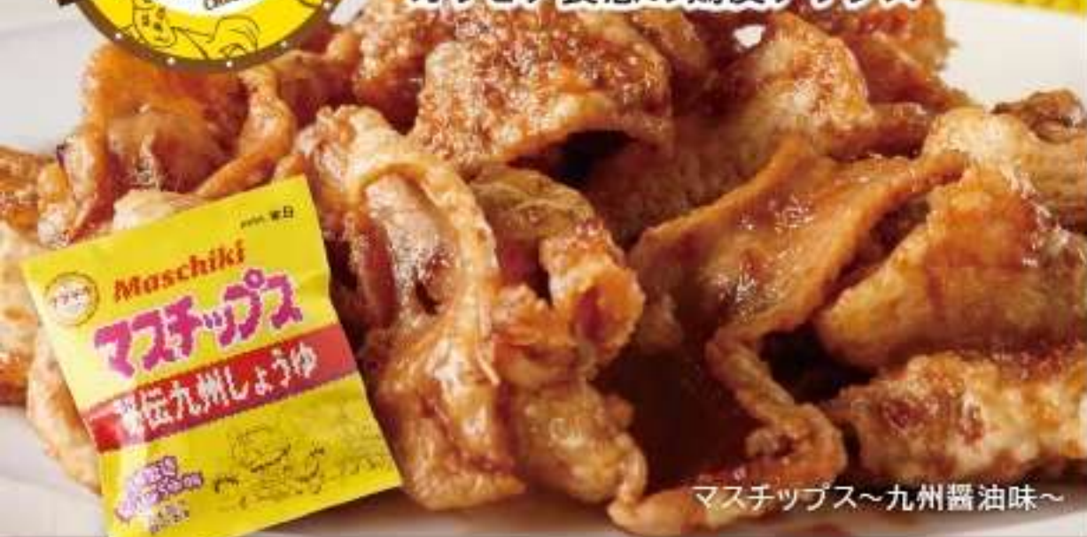
マスチップス～九州醤油味～