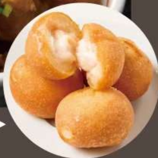
明太チーズボール▶