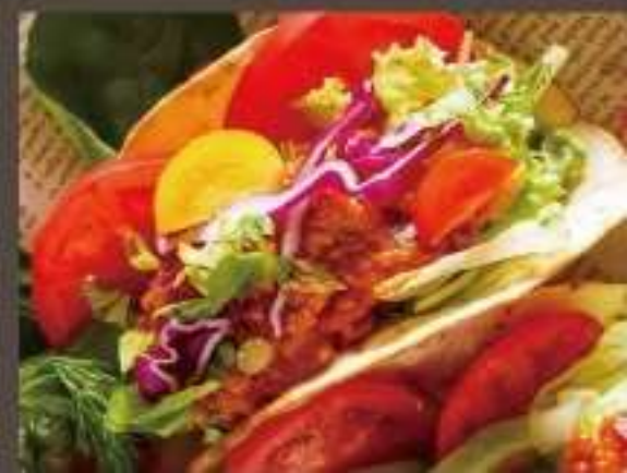
▶高たんぱく低温熟成チキータコス