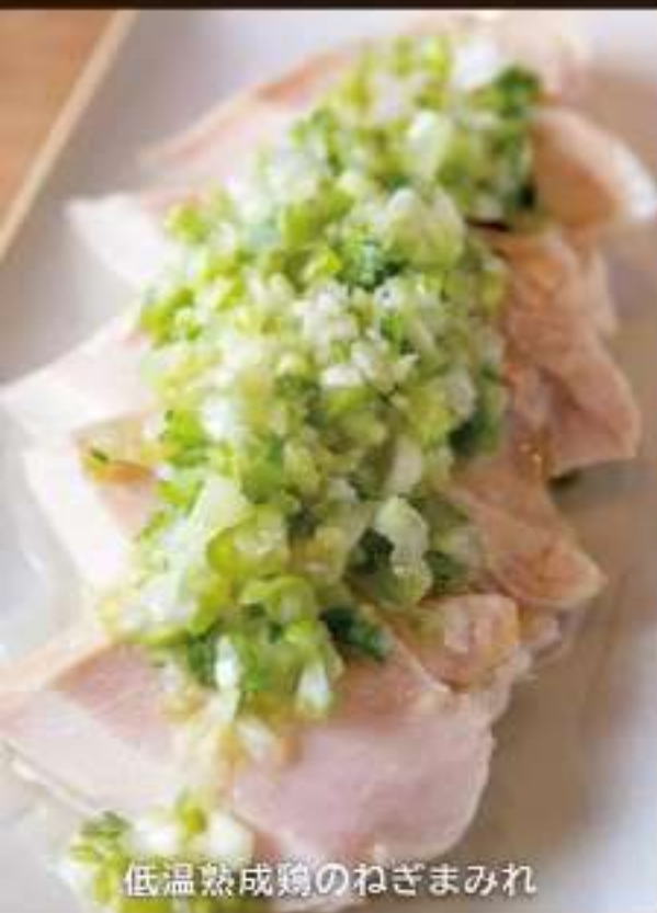
低温熟成鶏のねぎまみれ