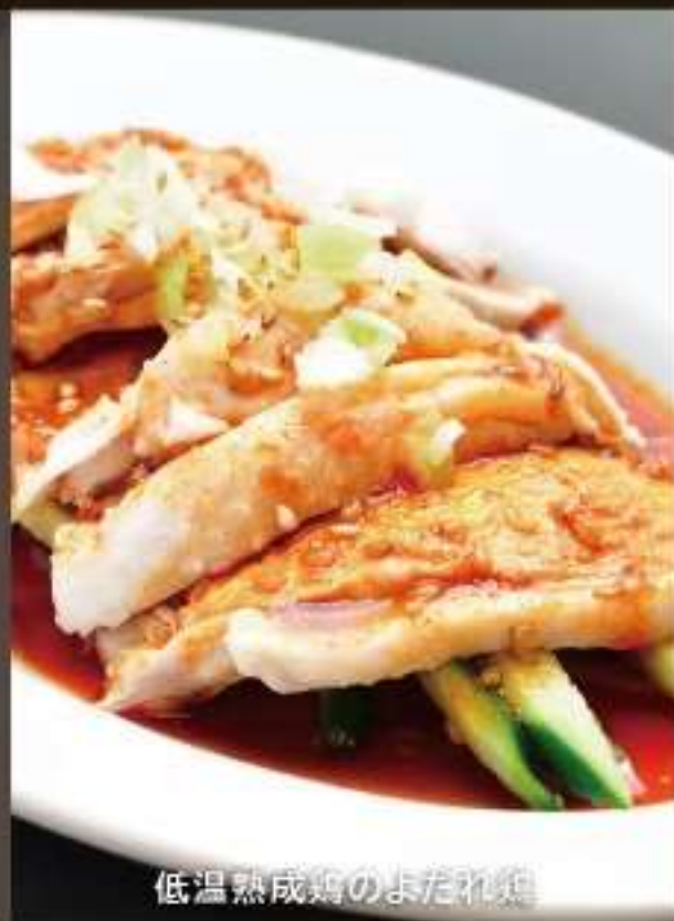
低温熟成鶏のよだれ鶏