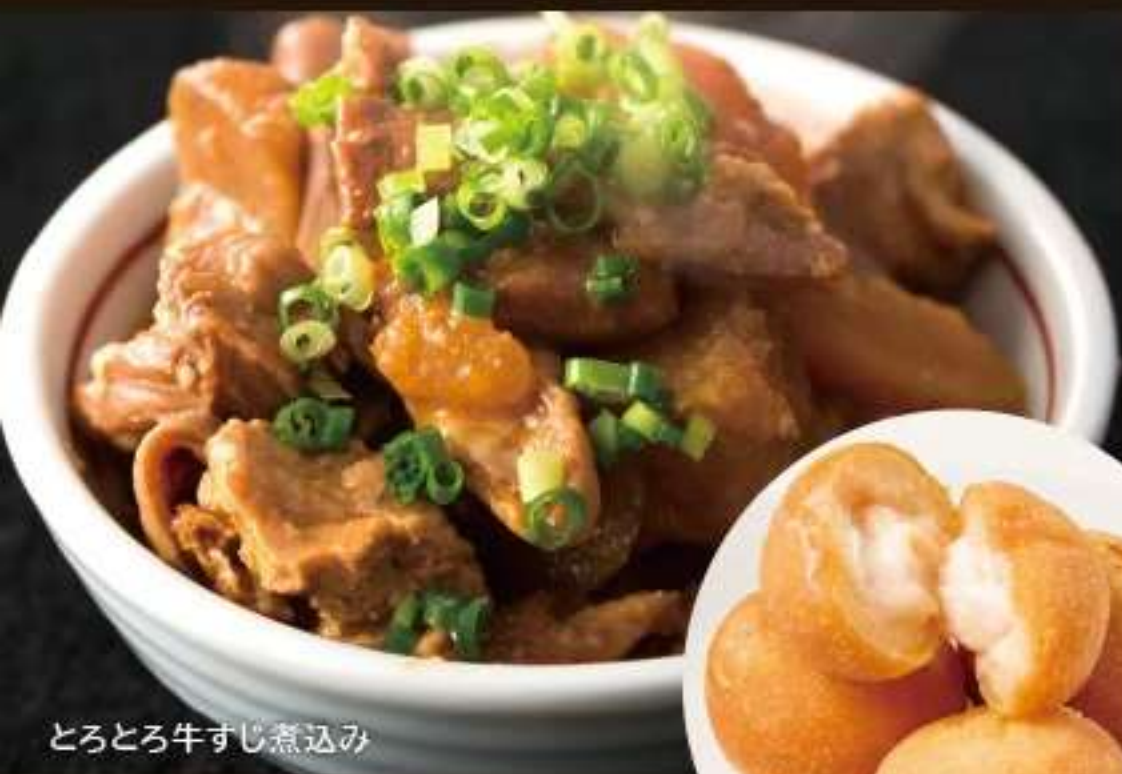
とろとろ牛すじ煮込み