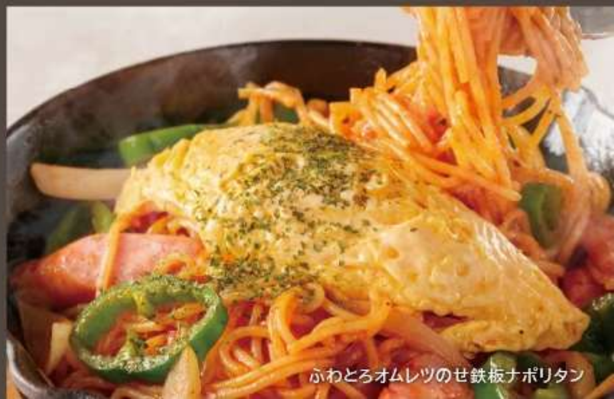
ふわとろオムレツのせ鉄板ナポリタン