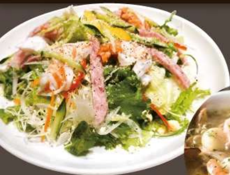
エビと雲仙ハムのシーザーサラダ