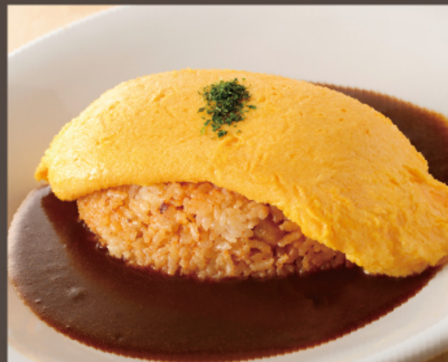
デミグラスオムライス