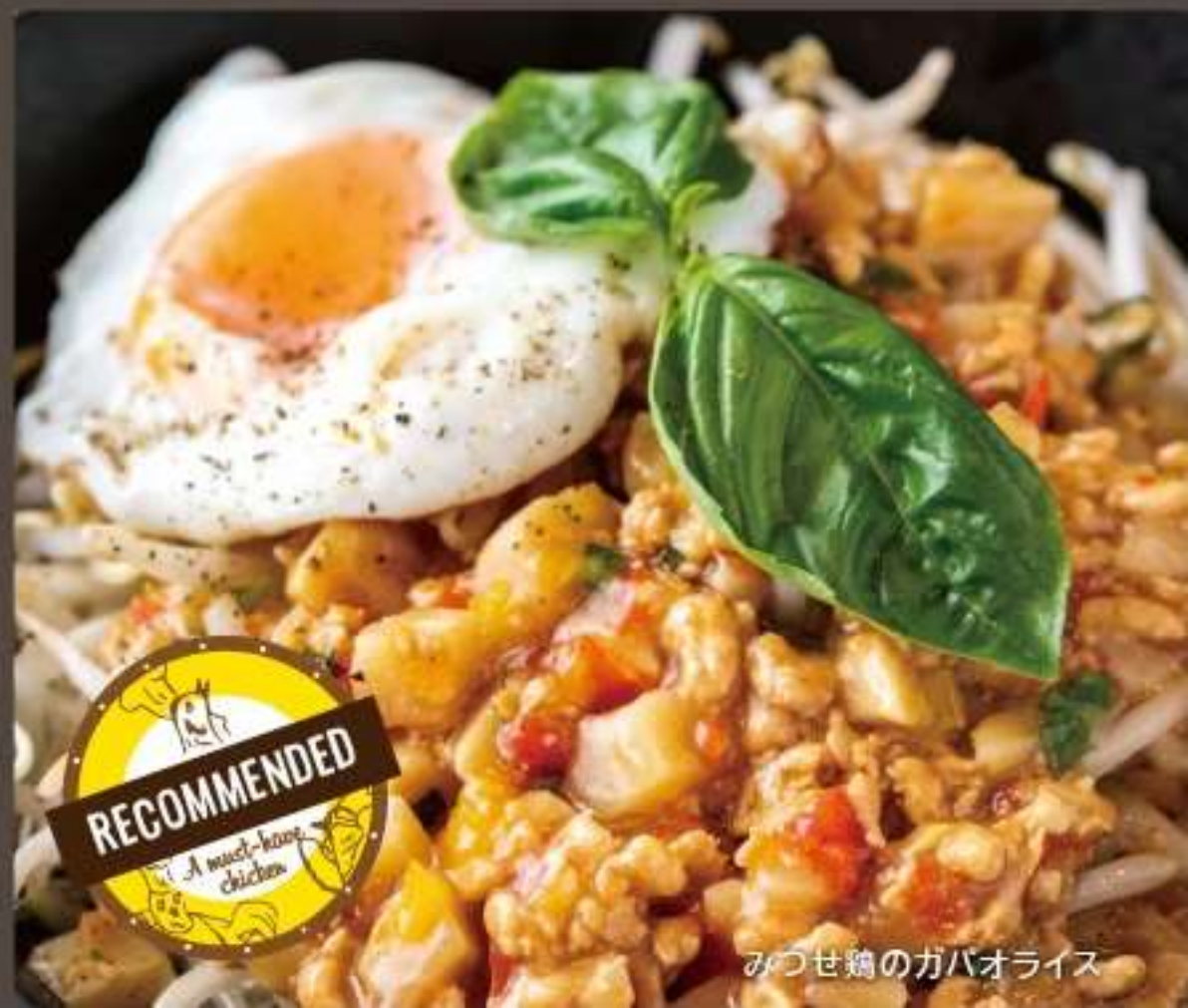
みつせ鶏のガパオライス