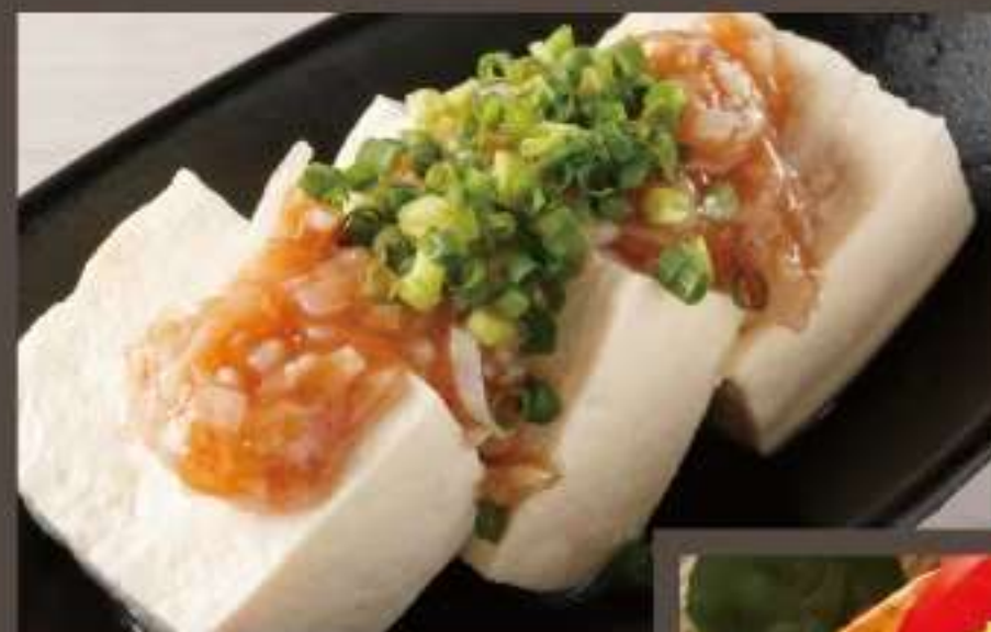
▲やげん軟骨梅肉のせ冷ややっこ