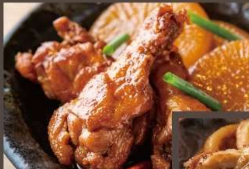
▲手羽元と大根のこってり煮