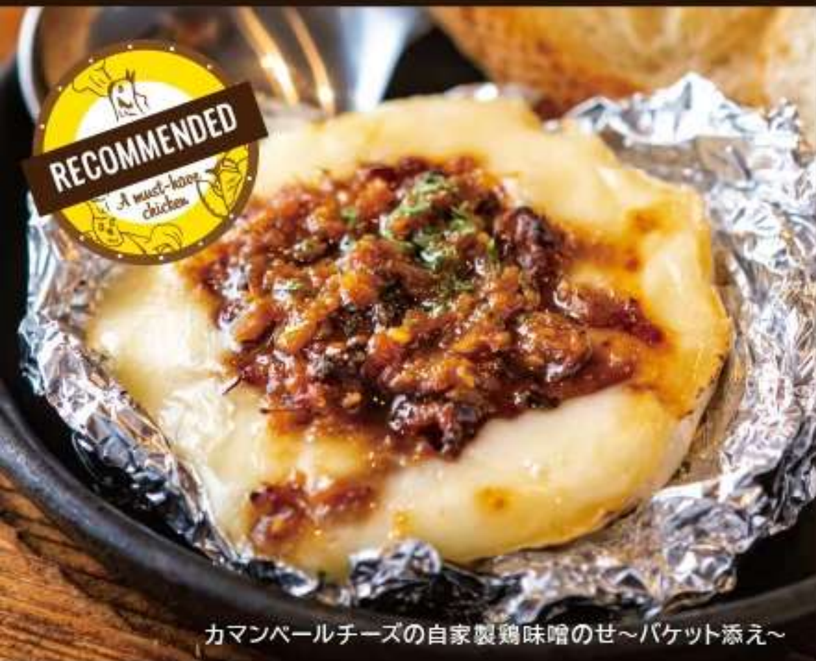
カマンベールチーズの自家製鶏味噌のせ〜バケット添え〜