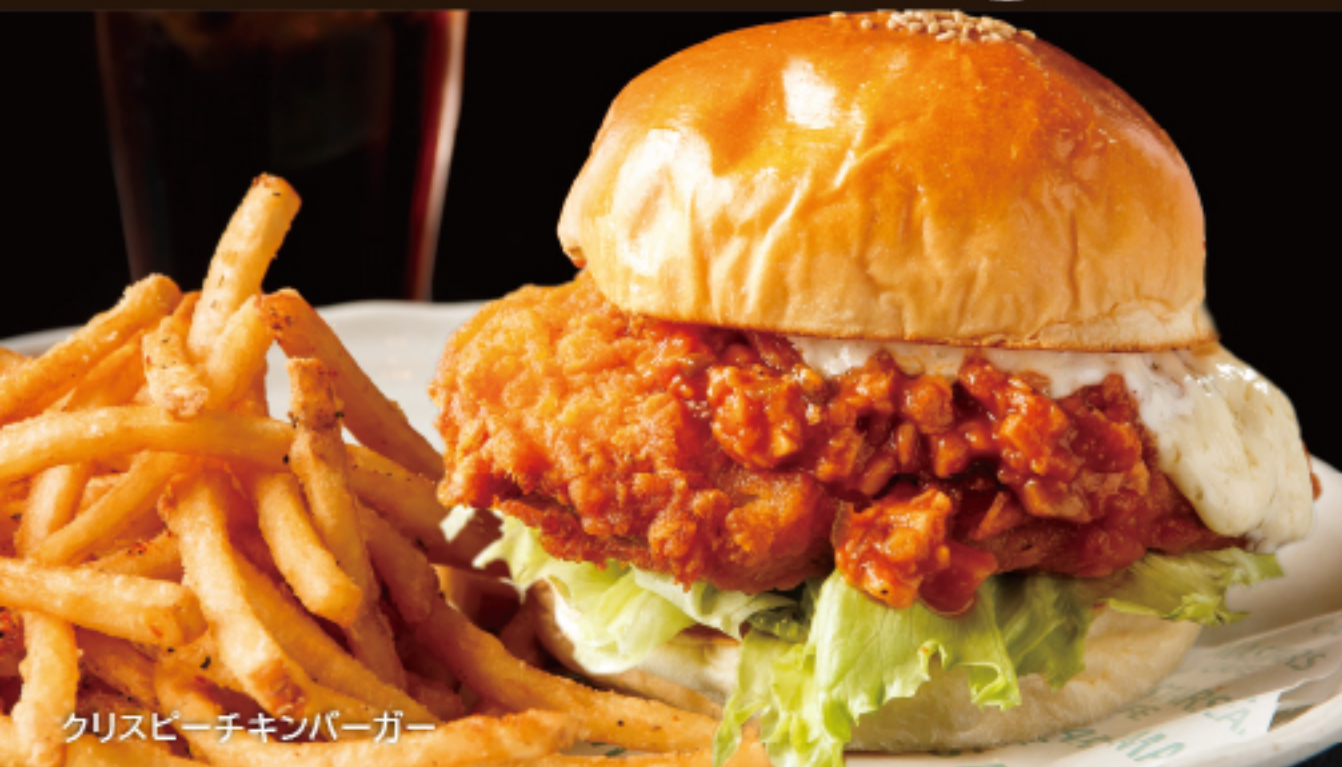
クリスピーチキンバーガー