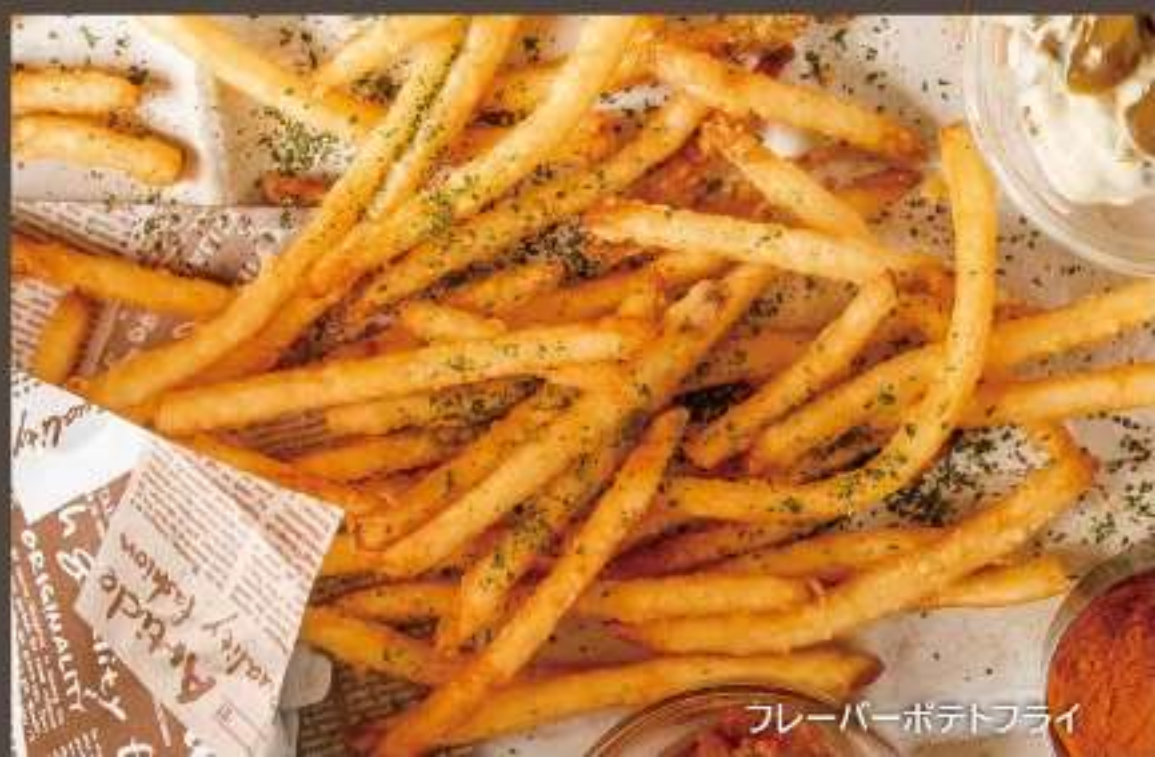
フレーバーポテトフライ